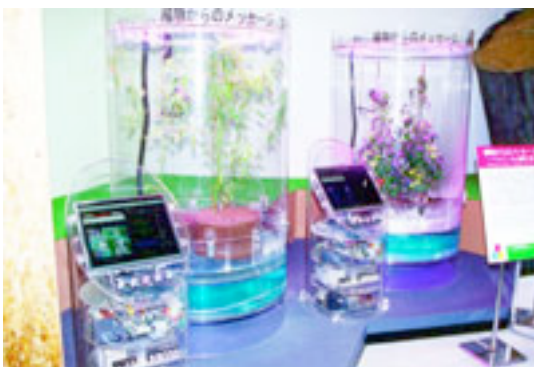
フルタ電機展示ブース 「バイオリンガル植物工房」