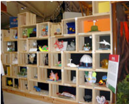
万博会場での展示ブース