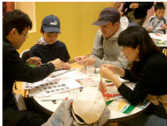
土、日の午前午後2回のワークショップを 開催